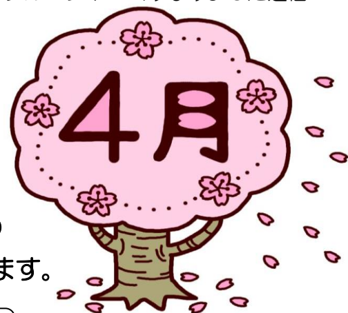
春のドライブ お花見

少し暖かくなり、春らしい気候になってきましたね。 冬の間は室内のイベントが多かったので、さっそく 外へ桜のお花見ドライブに行ってきました！ 満開の桜を見て、「きれいだね～」と皆さんも大満足の 様子でした！今月号では、4月のイベントをご紹介します。