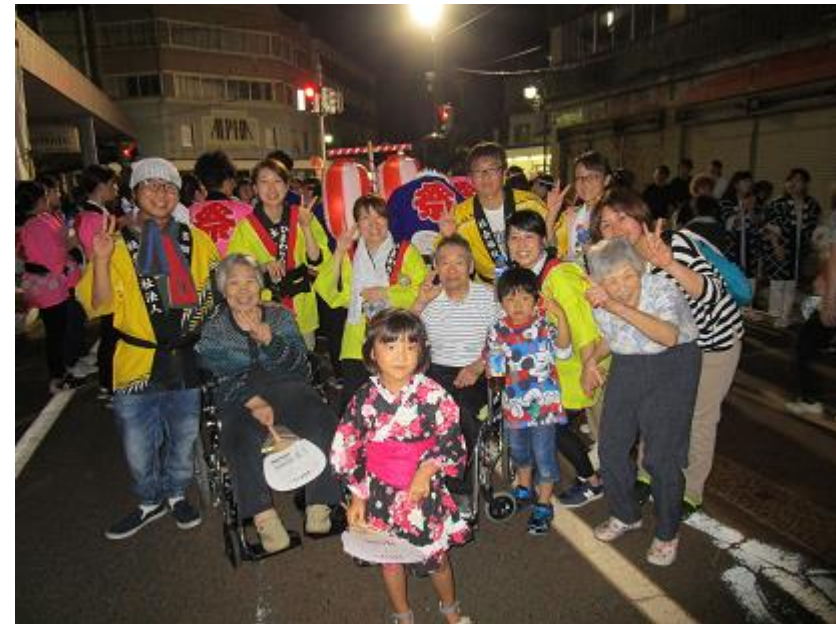
7月 民謡流し・お神輿☆