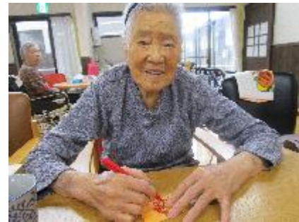
6月 長善のさと3周年祭☆