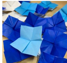
これを折って 貼り付けました