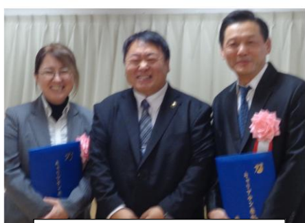
佐野市長と記念撮影

キャリアテン表彰式とは、燕市・弥彦村の介護施設において概ね10年以上勤務している職員に表彰を行う制度です。今回「ひまわり」からは2名の職員が表彰を受けました。 (燕市より承諾をいただき掲載しています)